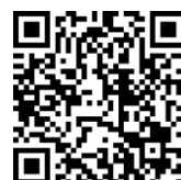
▲申し込みフォーム