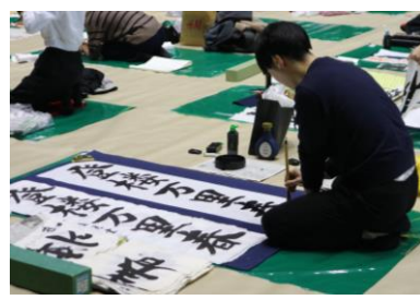
昨年の書初め大会