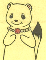
オコジョさん 更生保護女性会 マスコットキャラクター