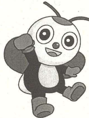
阿久比町 マスコットキャラクター 「アグビー」