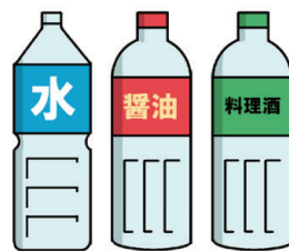
瓶装水、酱油、味醂等的空瓶