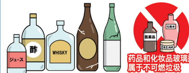
果汁瓶、破损的回收瓶(有回收标志的啤酒瓶或1.8升瓶等)、调味品瓶等 药品和化妆品玻璃瓶属于不可燃垃圾

请按种类分别放入蓝色容器内。罐类、瓶类和塑料瓶请先轻微冲洗。塑料瓶请压扁后丢弃。 取下盖子、瓶盖和标签,并做分类处理后扔出。(金属盖为不可燃垃圾,塑料盖和标签为塑料)