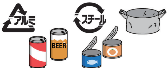
果汁、啤酒罐、锅、罐头罐等