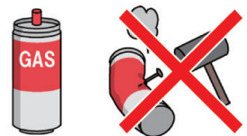
罐装家用煤气罐等