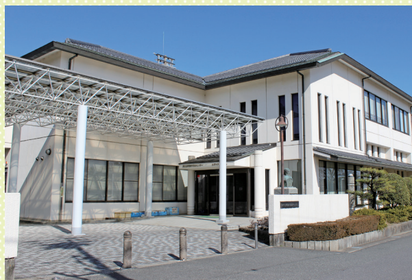
勤労福祉センター（エスペランス丸山）