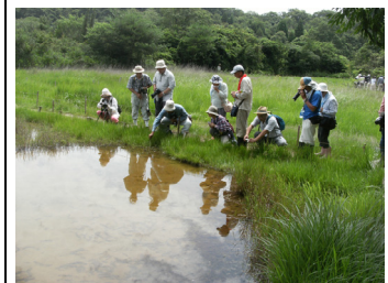
板山高根湿地 自然観察会