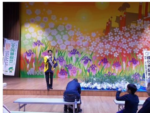
<産業まつりでの苗木の配布>