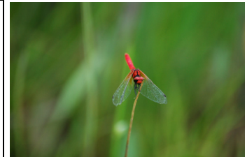
ハッチョウトンボ