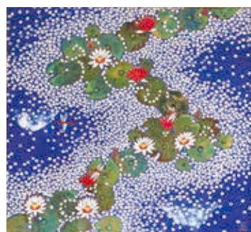
モネの池・彩交(作画 平松礼二氏) Monet's Pond・Colors Intervening (Reiji Hiramatsu)