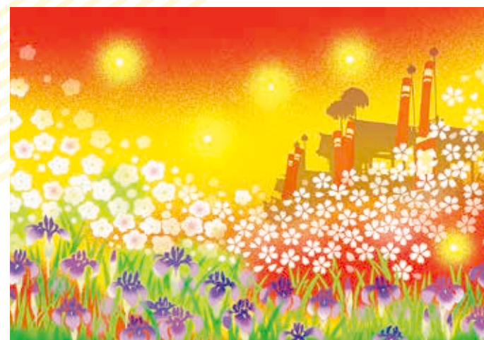
阿久比の誇り(アグピアホール舞台緞帳) The Pride of Agui (Agupia Hall Stage Curtain)

It is made with the wish that "children grow up in good health, and become adults who have confidence without losing their childhood innocence". Stones from the front steps of the former South Building Hall are used as a pedestal.