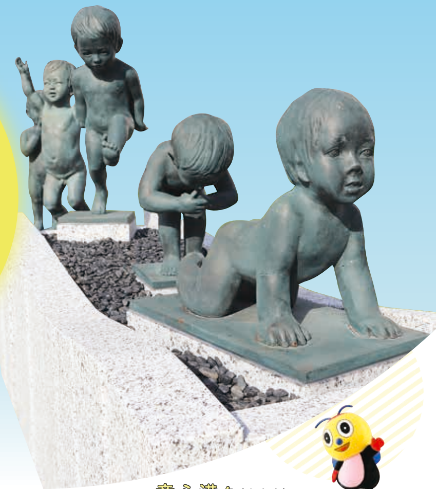
童心満々 (庁舎東) Full of Childhood Innocence (East of government multiplex)

Many art pieces are placed in various places of the new government multiplex.