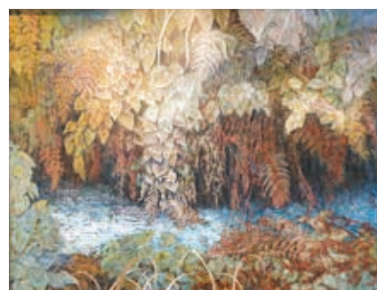
水の小路(作画 西脇隆道氏) Path of Water (Takamichi Nishiwaki)