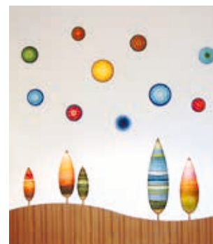
光のシンフォニー(アグピアホールホワイエ) Symphony of Light (Agupia Hall Howaie)