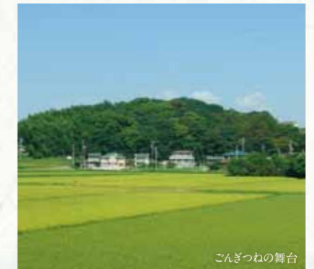
権現山(植大) Gongen Hill (Uedai)