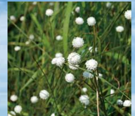
シラタマホシクサ(板山高根湿地) Eriocaulon nudicuspe (Itayama Takane Wetland)