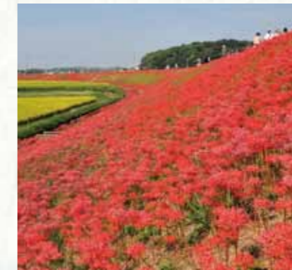
矢勝川の彼岸花 Red spider lilies along the Yakachi River