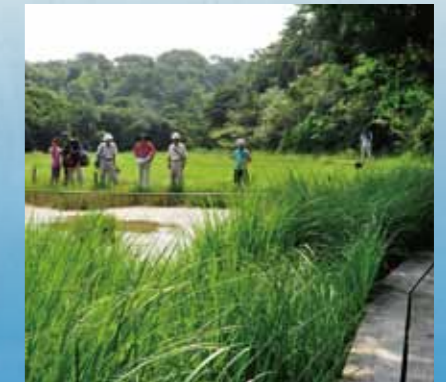
板山高根湿地 Itayama Takane Wetland