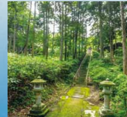
箭比神社の森(矢高) The forest at Yahi Shrine (Yataka)