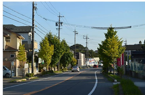
<都市計画道路知多東部線の街路樹>