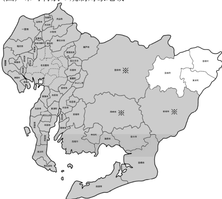
(図) 市町村別の規制対象地域

北設楽郡の設楽町、東栄町及び豊根村を除く県内市町村の、都市計画法の「工業専用地域」及び「都市計画区域以外の地域」を除く地域 (※) が規制対象となります。