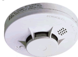
火災警報器イメージ