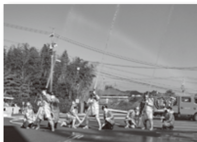
▲消防団員による一斉放水

■問い合わせ先 防災交通課防災係 ☎(48) 1111 (内1209・1210)