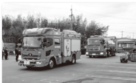
▲消防車両による分列行進