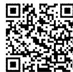
▲刈草・剪定枝回収のページ

※ 大量に持ち込まれた場合は、現場の係員が確認のため、声かけする場合がありますので、ご協力ください。