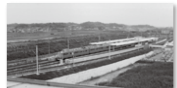
▲阿久比駅完成時の様子