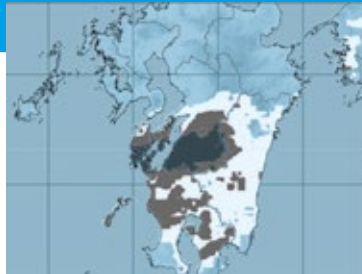
大雨警報(土砂災害)の危険度分布

▽気象庁が提供しているシステムで、どの場所で土砂災害、浸水害、洪水災害の危機が迫っているかを、地図情報で確認できます。