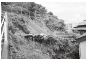
▲【10日】高岡(三ノ山高)地区土砂災害の様子