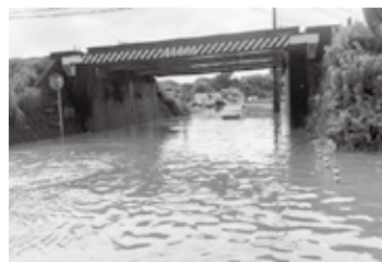
▲【12日】白沢台地区入口付近道路冠水の様子