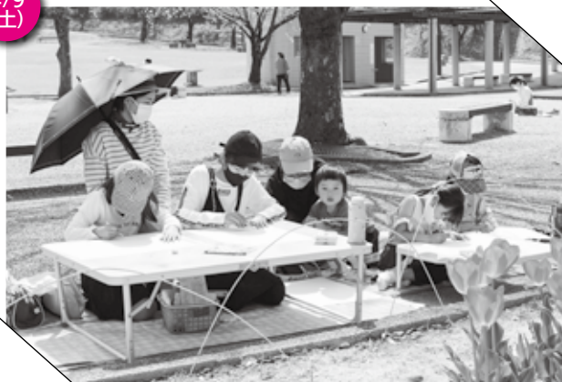
▲ 写生大会に参加した親子