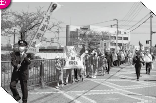
▲ 飲酒運転根絶パレードの参加者たち