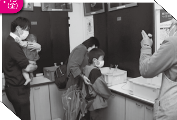
▲ 飼育箱をのぞく親子