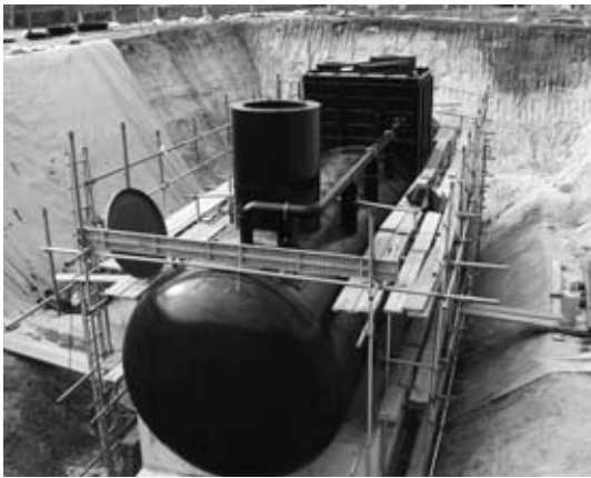
平成19年度に設置した飲料水兼用耐震性貯水槽

平成十九年度の一般会計の歳入決算額は、六十七億六千二百三十八万円で、前年度に比較し、一億二千七百五十一万円（一・九％）の減少となりました。これは、地方譲与税が一億七千五百十八万円の減、町債が一億五千八百九十六万円の減などによるものです。 歳出決算額は、六十二億六千七百九十四万円で、前年度に比較し、一億八千六百四十五万円（二・九％）の減少となりました。これは、英比小学校屋内運動場改築事業（三億一千七百万円）の完了が主な要因です。