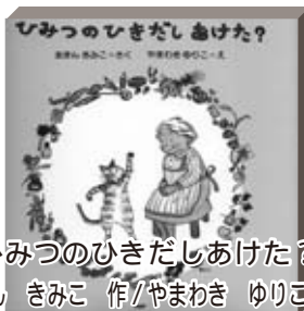
『ひみつのひきだしあけた?』 あまん きみこ 作 / やまわき ゆりこ 絵

おいしいのすみっこから、さくらいろの毛糸玉がころりと出てきた。すてきなベレー帽を編もうと思ったチイばあちゃん。かぎばりがないかと、古い机をあけると…。不思議なひきだしが楽しい、ほのぼの絵本。