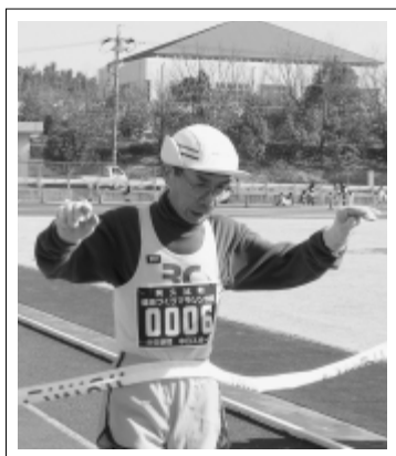
高齢者も元気にゴール