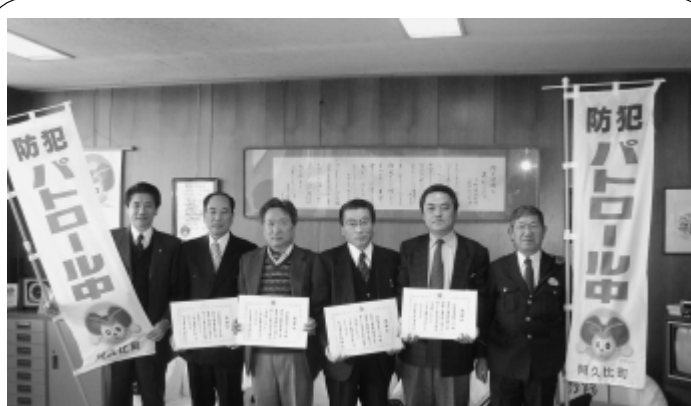
町長室へ報告に訪れた各団体の代表の皆さん