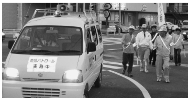
青色回転灯パトロール車と半田警察署パトカーで巡回を行う坂部地区の皆さん

青色回転灯 パトロール車で 町内を巡回 町では毎月第一、二金曜日を「防犯の日」と定めて、午後五時から午後八時まで地区（現在六地区）の皆さんの協力で防犯パトロールを行っています。 十月十四日には、防犯意識を高める目的でパトロール車に青色回転灯を取り付けて、各地区で防犯パトロールを行いました。