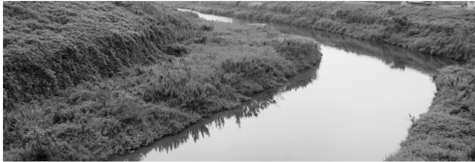
島田橋から見た阿久比川