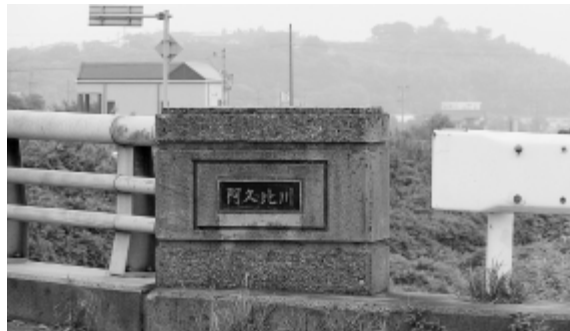
宮津橋にある石碑