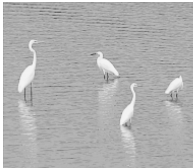
川に飛来した鳥たち