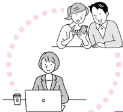
スマートフォン・パソコンから申し込み