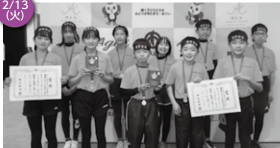
▲ 男女の部での三連覇達成に喜び阿久比Aチームの皆さん