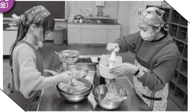
▲ 機械で大豆をつぶす参加者