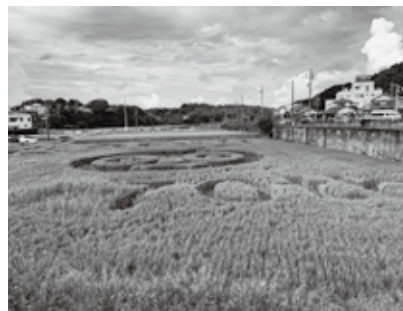
▲9月現在の田んぼアートの様子