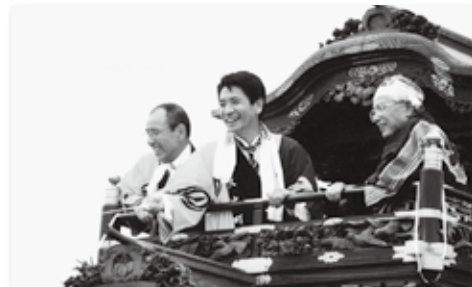
町制50周年山車まつり