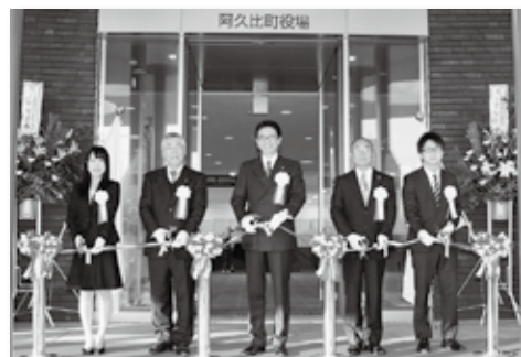
新庁舎が完成し、供用開始