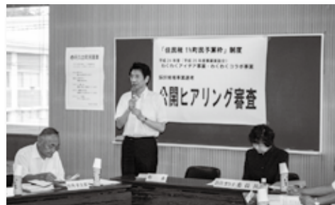
住民税1%町民予算枠制度開始