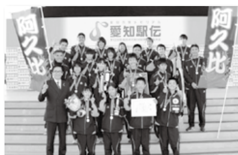
悲願の愛知駅伝初優勝(町村の部)