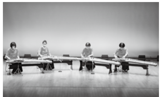
▲ 日頃の成果を披露する出演者