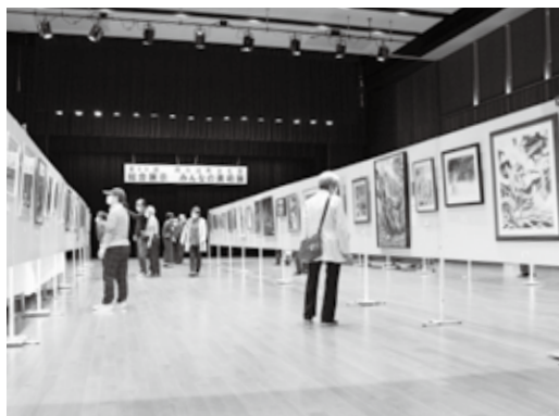
▲ 展示物を鑑賞する来場者

芸能大会は、11月5日・6日の2日間行われました。子どもから大人までの幅広い出演者たちが、多くの観客を前に琴やダンス、詩吟など日頃の練習の成果を披露し、会場からは大きな拍手が送られました。