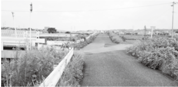
▲ 古見堂橋付近の様子