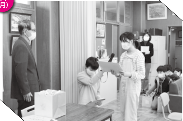
▲ 感謝の言葉を述べる児童会役員