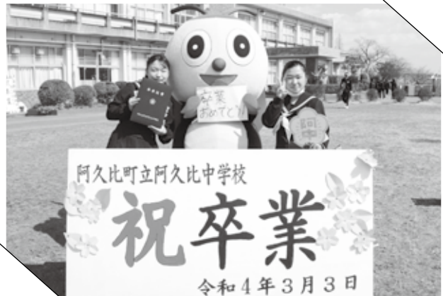
▲ アグピーもお祝いに駆け付けたよ！