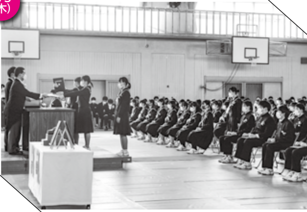
▲ ひとりひとりに卒業証書が授与されます