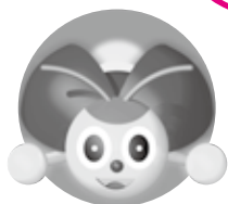
町マスコットキャラクター アグビー

ホタルは5月下旬に水から上陸し、土の中でサナギになります。サナギになったホタルは、6月中旬から7月上旬に羽化します。羽化したホタルは、草の中で、休憩や求愛活動を行います。この時期は土手の草刈りを行うと思いますが、できる限り刈った草を燃やさないようご協力をお願いします。