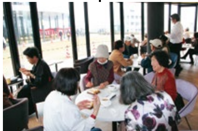
食堂棟(カフェ&レストラン桜坂)

開庁日の午前11時から午後4時30分まで営業しており、どなたでもご利用できます。屋外の階段から緑側モールへ上がれます。