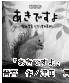
『あきですよ』 柴田 晋吾 作 / 津田 真帆 絵

森ではきのこが育ち、木々の葉っぱが色づいた。山では猿たちが柿の実をほおぼっている。海では漁師たちがせっせとさけを捕っている。たんぼでは…。色んな場所の色んな生きものたちの、秋の様子を描いた絵本。