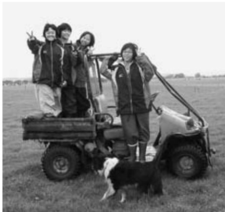
ケンブリッジの農場でファームステイを体験