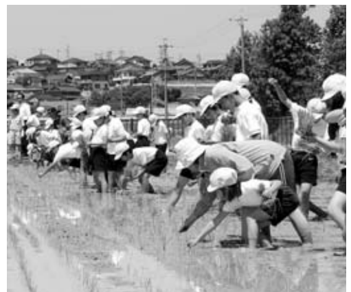
英比小学校での田植え

今は、毎日四十五分間歩いて、ストレッチや健康体操も行って、病気になるからでは遅いので、