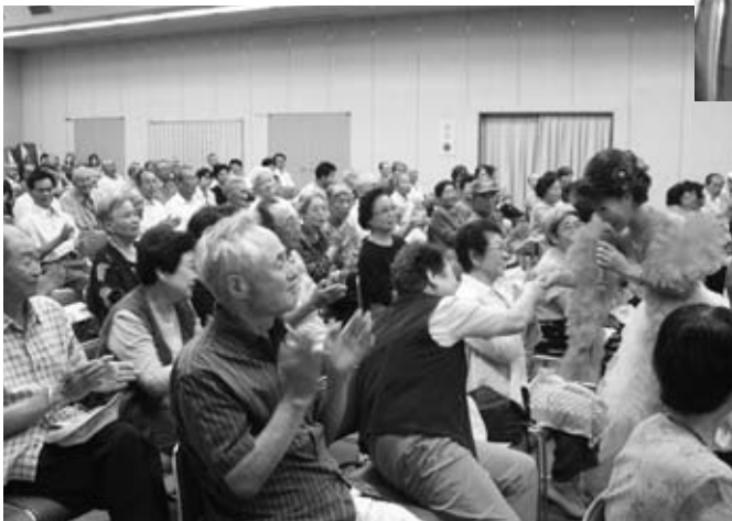
余興を楽しむ高齢者

9月16日、エスペランス丸山で敬老会が行われ、参加した70歳以上の高齢者約200人の長寿を祝いました。