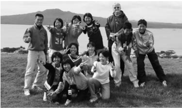
デヴォンポートのマウントビクトリアで記念撮影

中学生はニュージーランドで農業体験をするファームステイ、海外の家庭生活を経験するホームステイ、英会話を学ぶ語学学習を行ってきました。