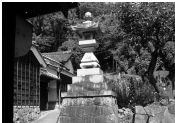
秋葉神社の参道入口に建つ常夜燈

たが友人は以外と「オタク」なのかもしれない) 第八チエックポイント「萩の常夜燈」を通過して、最後の第九チエックポイント「萩大山車鞘蔵」に到着。流れる汗をタオルでぬぐい、鞘蔵の前に座り込み休息を取る。出発地点の東部小学校へと向かう。キンモクセイの木が民家の庭先に見える。花を咲かせ、秋風とともに、甘い香りを運ぶのも、間もなくのことだろう。晴れわたる空は青空夢と希望と。白雲と。友人が歌う。「今日の日にびつたりの詞だねえ。そのメロディーどこかで聞いたよなあ」と私が聞く。「我が母校、東部小学校の第三番です」。史跡めぐりコースは友人の歌に始まり、歌で終わった。