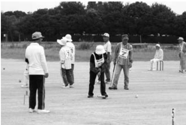
所狭しと会場を動き回りプレーをする老人クラブのメンバー

9月11日、町ゲートボール場で阿久比町老人クラブ連絡協議会秋季ゲートボール大会が開かれました。