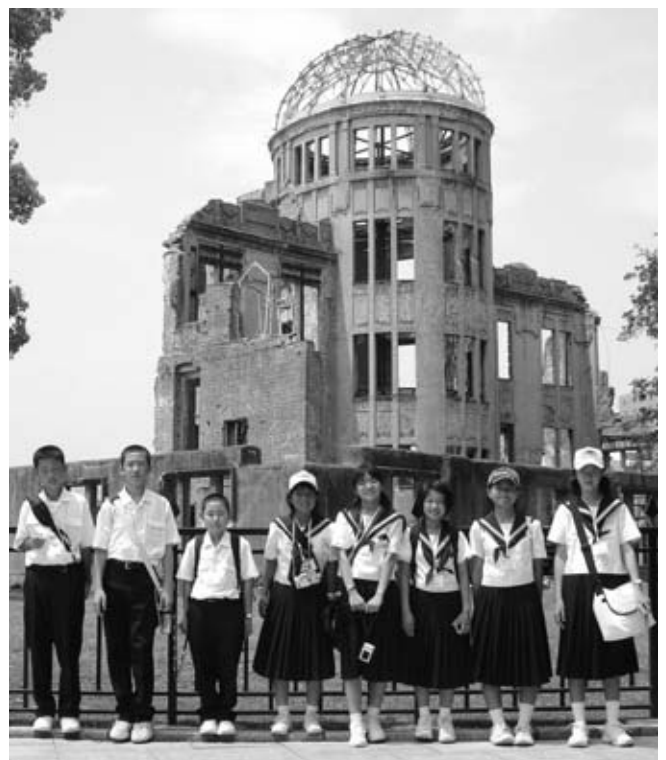
原爆ドーム前で平和への気持ちをあらたにする中学生

私は広島へ実際に行つて、学んできたことを自分だけにとどめず、みんなに知ってもらえるように、機会あるごとに話していこうと思います。