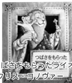
『つばさをもらったライオン』 クリス・ヨノヴァー 作

金色のたてがみのレオ王には、一つ気になることがあった。それは、北に住むオットー王の宮殿の壁に並んでいる不思議な宝物のことだった。そんなレオ王に翼を持った王子が生まれ…。