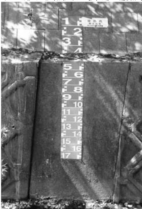
殿越川の河川水位警戒標識