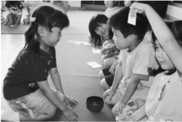
礼儀作法を学びながらお茶を楽しむ南部保育園児

6月22日、南部保育園で「お抹茶会」が行われ、年長組32人が礼儀作法を学びました。