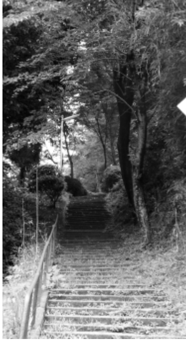
頂上からの眺めが素晴らしい秋葉神社参道