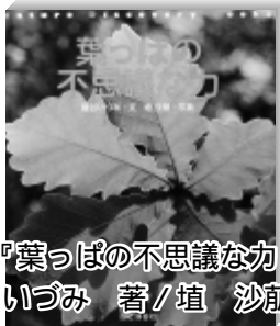
『葉っぱの不思議な力』 鷺谷 いづみ 著 / 埴 沙萌 写真

緑の葉っぱは、この地球のあらゆる場所に、生き物にとっての食料庫がつねに満たされているように、働き続けている。そのおかげで、地上のあらゆる生命の暮らしが成り立っている。葉っぱのふしぎがわかる本。