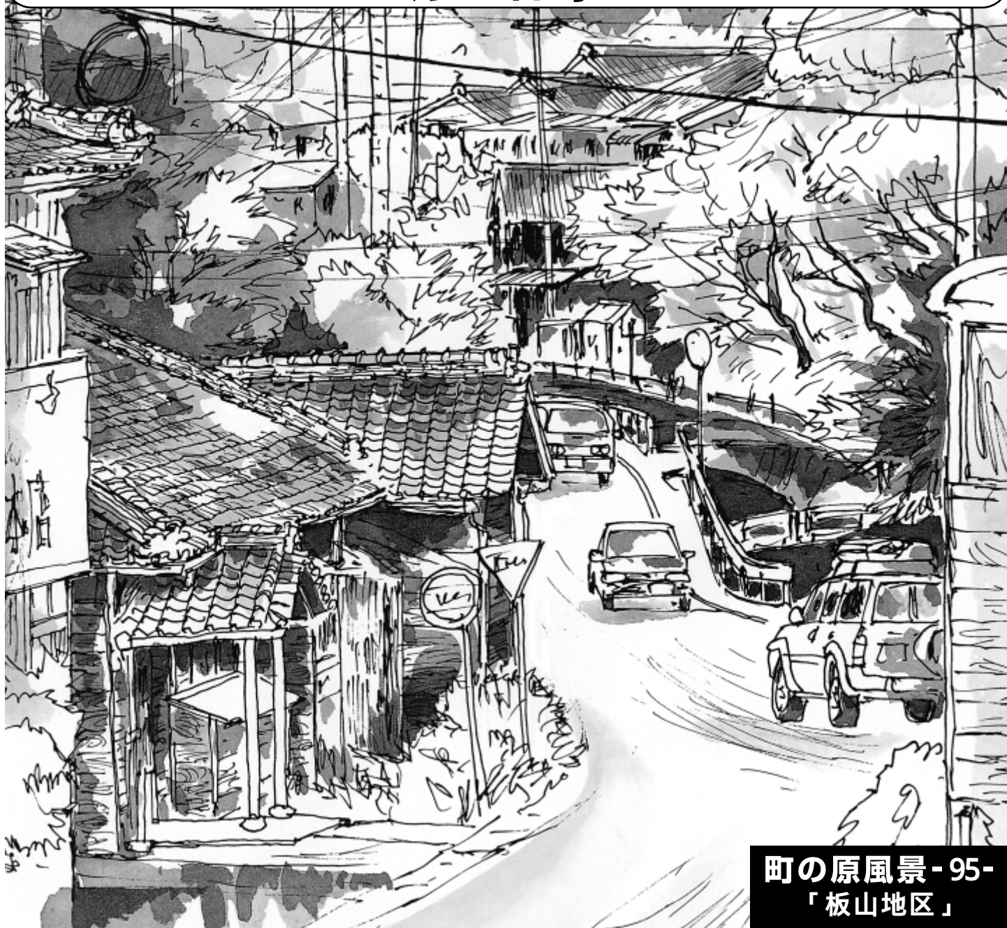
町の原風景-95- 「板山地区」