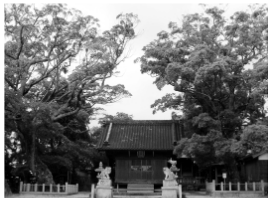
熱田社に2本並ぶ天然記念物の楠