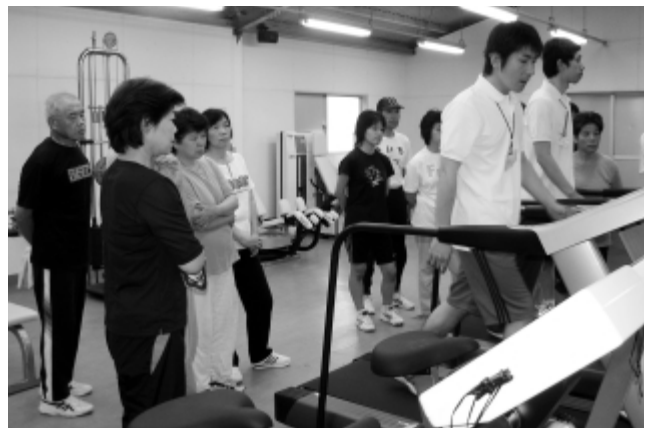
講習会で機器の説明を受ける受講者