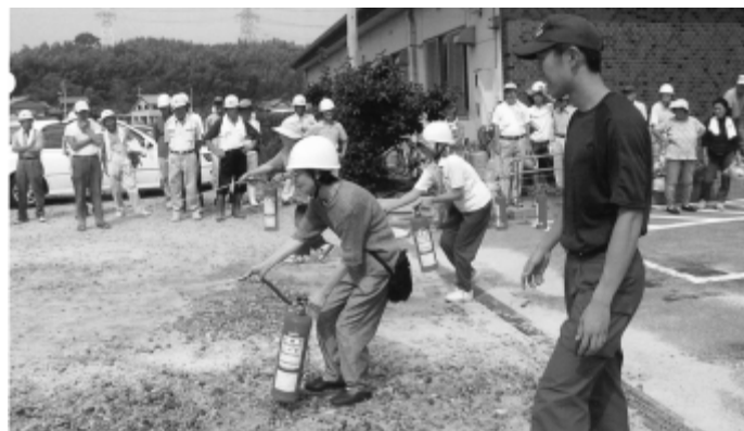
防災訓練を行う白沢自主防災会

このような状況の中で危険が迫ってきたら、どのように行動しますか。隣の家から煙が出ていたら、近所の人々が倒壊家屋の下敷きになっていたら、知人がケガをしていたら…。自らの手で初期消火や救助・救出