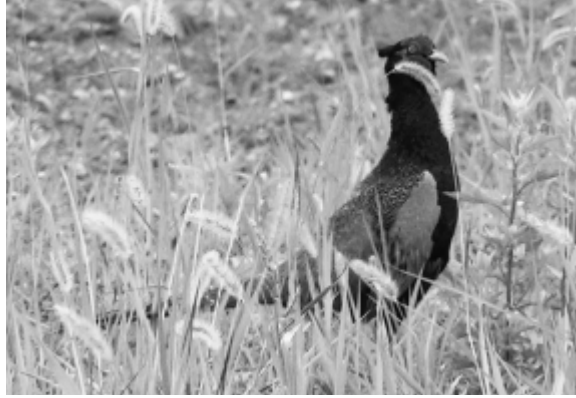
偶然出会ったキジ