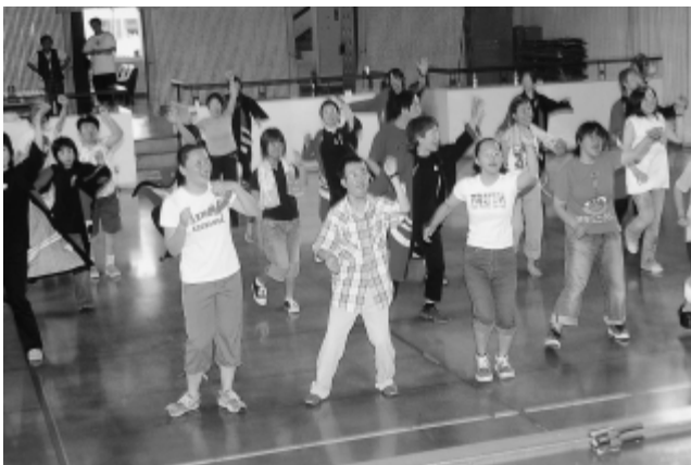
よさこい踊りを楽しむ参加者

7月2日、中央公民館南館ホールでもちの木園の園生や家族、ボランティアらによる「なかまの会」が行われました。