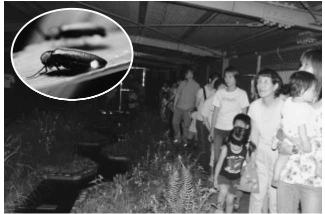
ホタルを観察する参加者

6月24日と25日の2日間、ふれあいの森ホタル養殖場で「ほたる観察会」が行われ、約2,500人の参加がありました。