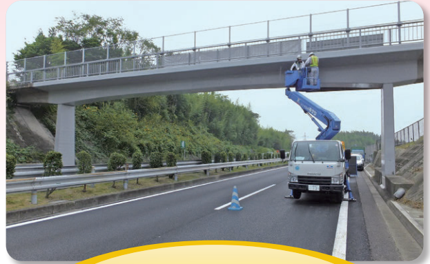
新 きょうりょう 橋梁長寿命化事業 道路橋定期点検 1,851万9千円