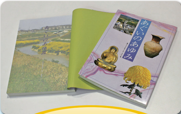
新 シティプロモーション推進事業 あぐいのおゆみリニューアル 777万5千円