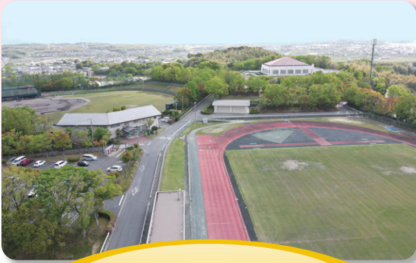
阿久比スポーツ村 整備事業 4,401万円