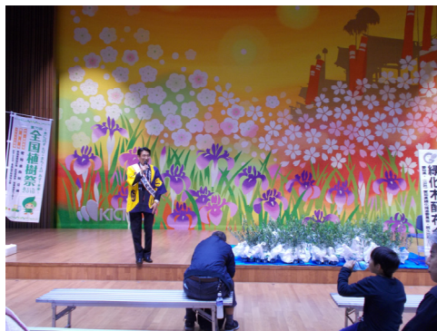
<産業まつりでの苗木の配布>