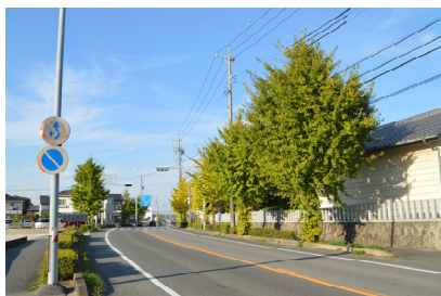
<(都)知多東部線 街路樹>