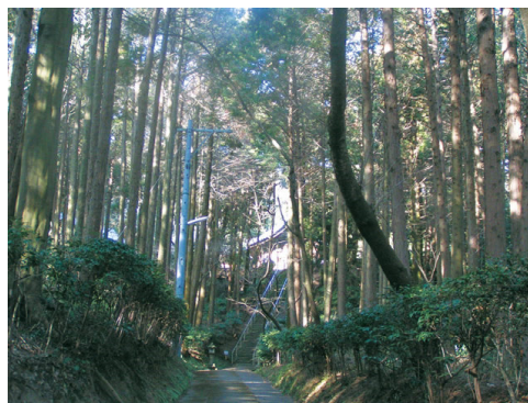
<箭比神社の社寺林>