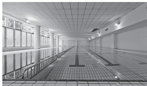
スポーツ村/アグスポ(交流センター)プール