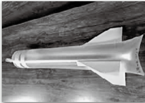
▲かさぶくろロケット