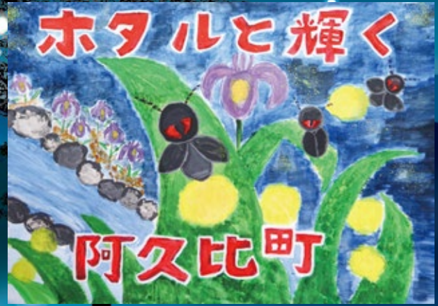
やまもと かな 山本 菜奈 (南部小5年)