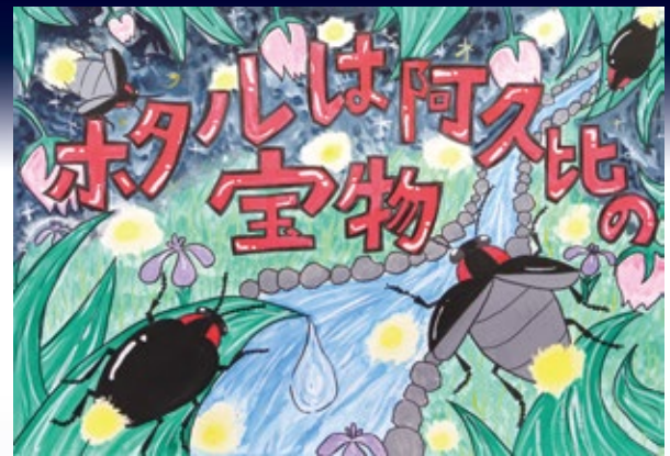
たなか のぞみ 田中 希 (東部小6年)