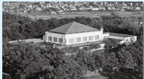
▲アグスポ(阿久比スポーツ村交流センター)

今後、中央公民館多目的ホールの「アグピアホール」や給食センターの「アグモグ」のように多くの皆さんに親しみをもって利用していただけるよう、愛称「アグスポ(AGUSPO)」を活用していきます。