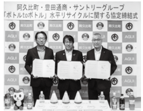
▲ 協定締結式の様子

皆さんのペットボトルの排出方法に変更はありませんが、一人一人の取り組みが、地球環境の未来を支える大切な一歩です。今後も正しいペットボトルの分別、リサイクルにご協力をお願いします。