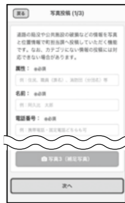
▲必要項目を入力し、写真を添付