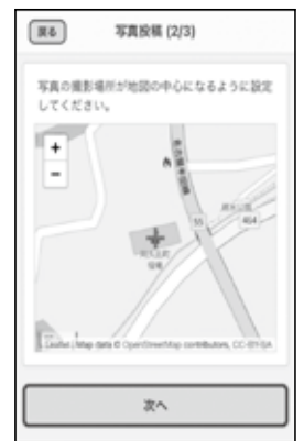
▲写真投稿位置を確認