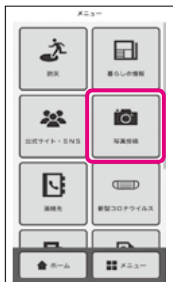
▲アプリを開き、メニュー画面から「写真投稿」ボタンを選択