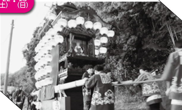
▲ 提灯の灯った横社山車