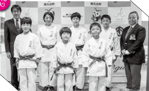
▲ 全国大会出場を報告した選手の皆さん