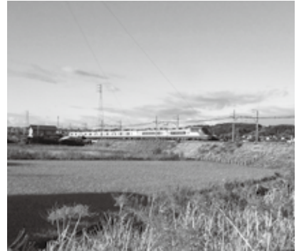
▲ 第2回グランプリ受賞作品

応募・問い合わせ先 阿久比町観光協会事務局 ☎(48)1111(内1226) 電子メール aguikanko@gmail.com 〒470-2292 阿久比町大字卯坂字殿越50(役場2階産業観光課内)